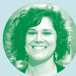
ORGANISATION SPORTIVE WATERPOLO QUÉBEC