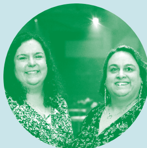
INITIATIVE DE L'ANNÉE CODIRECTION GÉNÉRALE Natation Artistique Québec